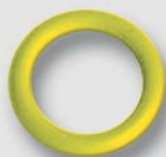
Art. FP.KR STANDARD O-kroužek pro vodu, topení a plyn