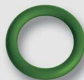
Art. FPS.KR SOLAR O-kroužek pro solární systémy